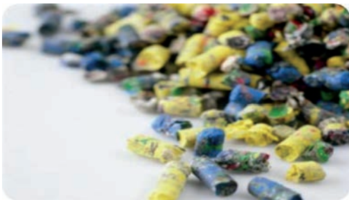
Les pellets ou CSR HPC (combustible solide de récupération à haut pouvoir calorifique)

Ces pellets sont ensuite utilisés par les cimenteries comme combustibles pour leurs fours.